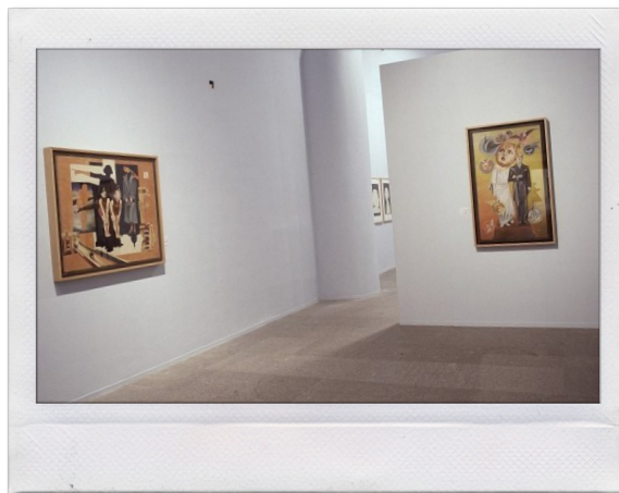
Exposición- Hannah Höch. Museo Nacional Reina Sofía (Madrid)