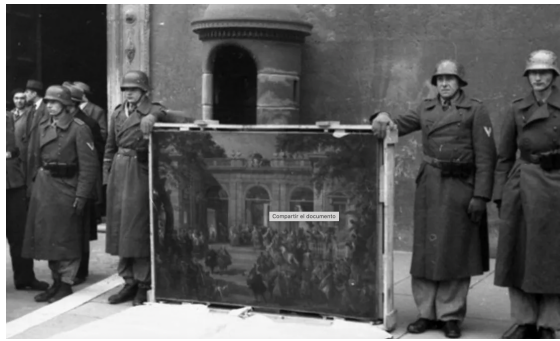
Cuadros confiscados por los nazis.

Con la llegada al poder de Hitler en 1937, los artistas dadaístas fueron perseguidos por los nazis y catalogados como Bolcheviques. Durante este período, aunque Hannah Höch siguió creando, no fue hasta el final de la II Guerra Mundial cuando pudo compartir su obra para que fuese reconocida y disfrutada, hasta hoy, por todos nosotros.