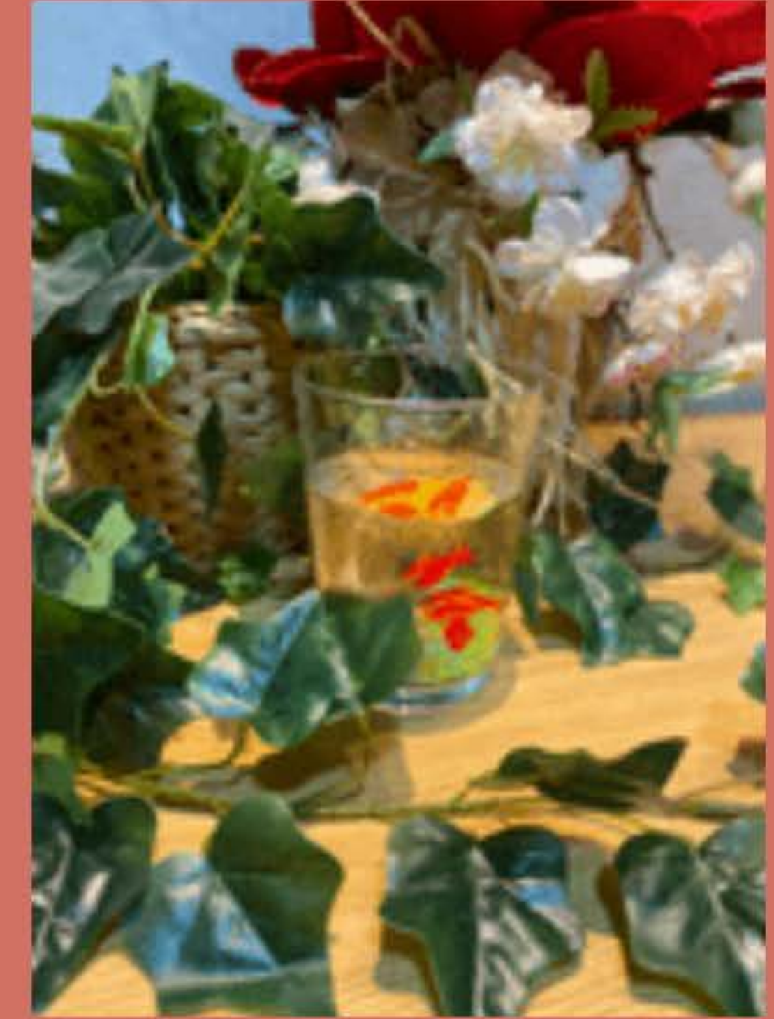
Como pez en el agua (I pesci rossi)